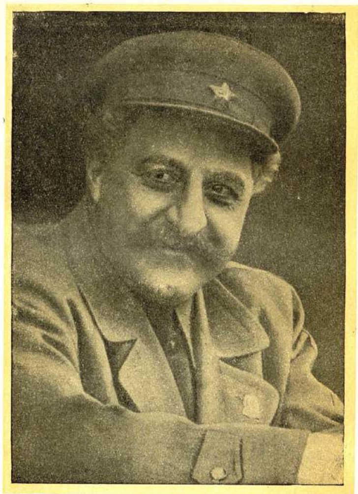
Г. К. Орджоникидзе. 1955 г.