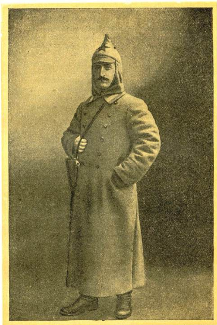
Г. К. Орджоникидзе — член Революционного Военного Совета Кавказского фронта. 1920 г.