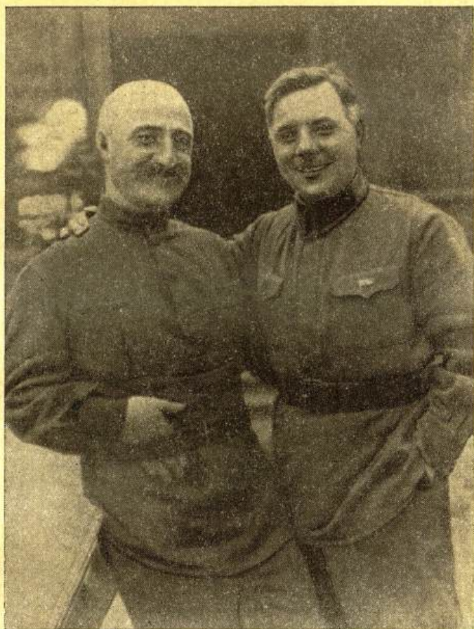
Товарищи Г. К. Орджоникидзе и К. Е. Ворошилов. 1929 г.