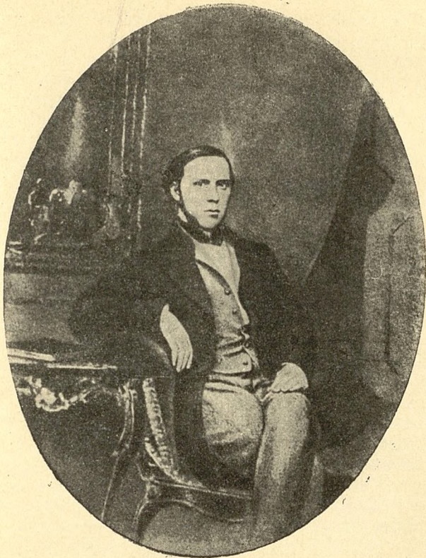
М. Е. Салтыков-Щедрин (Акварель неизвестного художника 50-х годов)