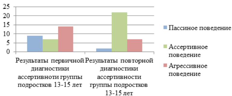
Рис. 1. Оценка изменения уровня ассертивности по диагностической методике «Тест ассертивности личности» В. П. Шейнова (2014)

Таким образом, тренинг ассертивности изменил уровень ассертивности личности подростков 13–15 лет.