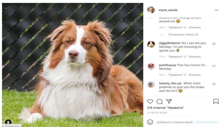
Рис. 3. Пример публикации с хэштегом #captionthis

Подписаться на аккаунты англоязычных звезд. Большинство знаменитых людей имеют аккаунты в «Инстаграме», включая звезд Голливуда. Они публикуют фотографии, снимают истории, проводят прямые эфиры и иногда общаются с фанатами в комментариях.