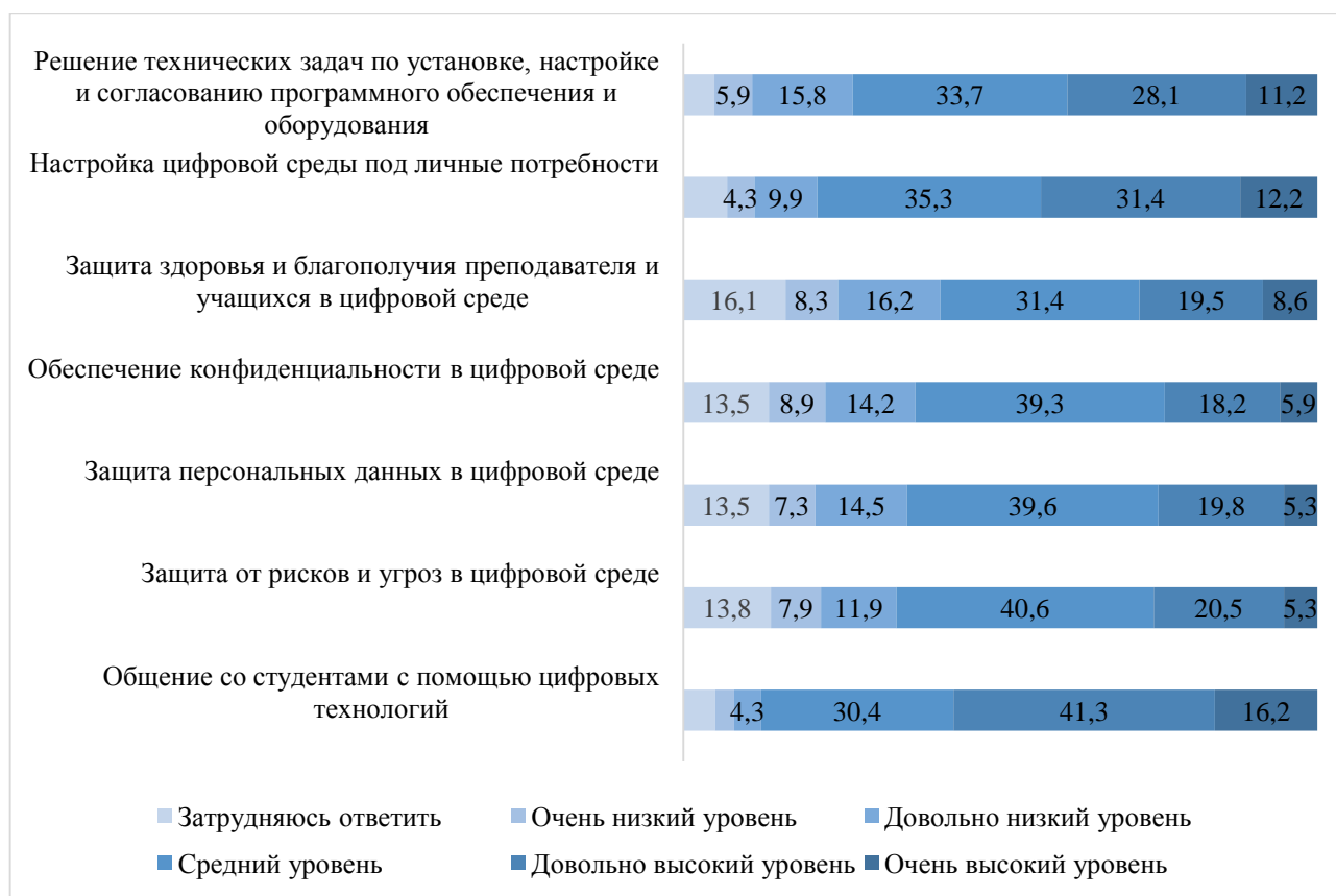
Рис. 2. Оценка умений и навыков, необходимых для организации и проведения занятий с применением дистанционных технологий (N = 303 человека, %)