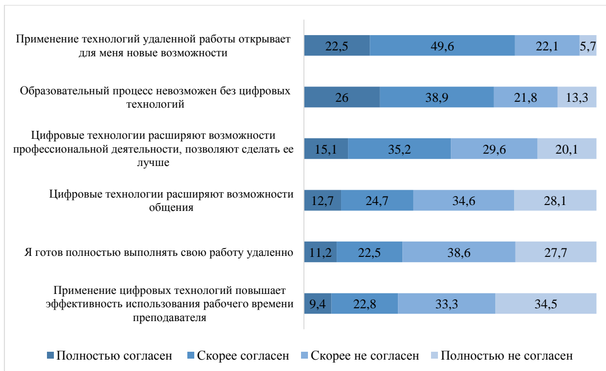
Рис. 3. Распределение ответов на вопрос: «Согласны ли Вы с приведенным суждением (о роли цифровых технологий в профессиональной деятельности)?» (% респондентов)