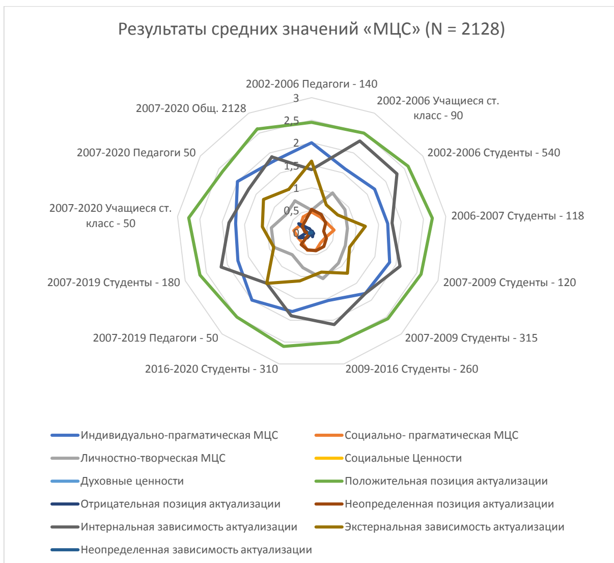
Рис. 1. Результаты средних значений по методике «МЦС» (N = 2128)