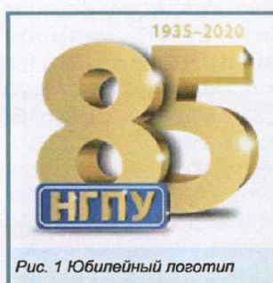
Рис. 1 Юбилейный логотип

В 2020 году Новосибирский государственный педагогический университет отмечает 85-летний юбилей библиотеки (рис.1). День рождения библиотеки не совпадает с университетским (первое упоминание о библиотеке пединститута в архивных документах относится к 1938