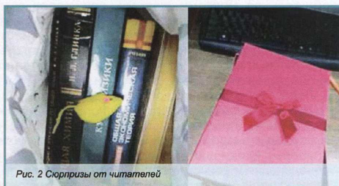
Рис. 2 Сюрпризы от читателей

Читатели отнеслись к такой форме работы положительно и даже с юмором, вкладывая в пакеты