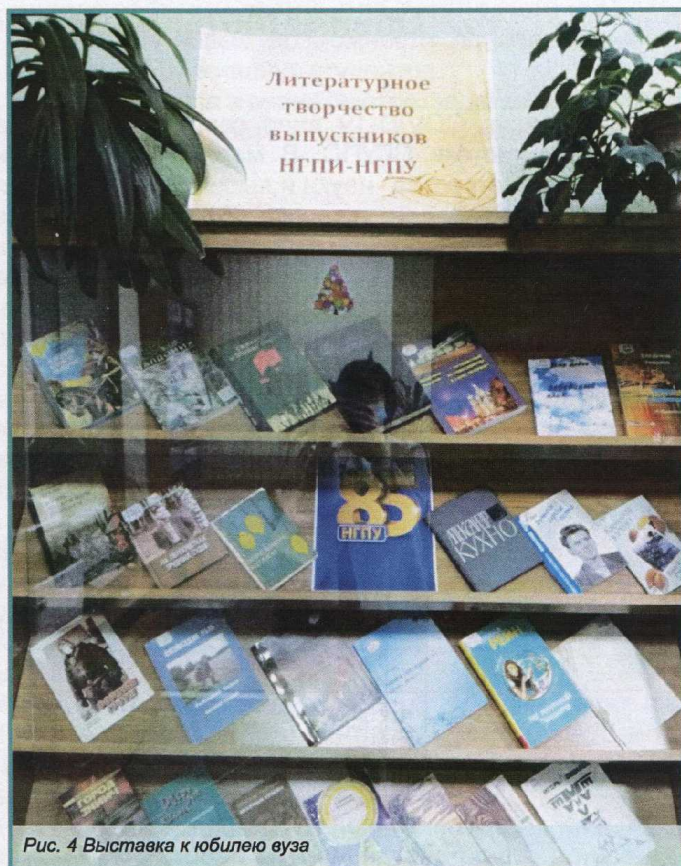
Рис. 4 Выставка к юбилею вуза

Репозитория НГПУ невозможно сравнить с предыдущим годом, т.к. ресурс был запущен только в январе 2020 года. Можно лишь сказать, что им хорошо пользовались, и в приоритете были научные издания.