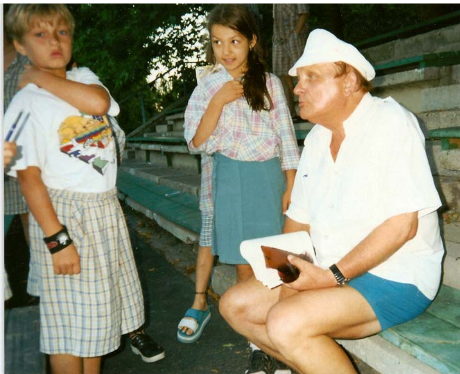
«А дело-то непростое...». Начальник беседует с ребятами из младшего отряда.

Всему этому по мере сил нужно помогать, кое-чему можно и научить. В помощи тем, кто только «становится на крыло», – смысл педагогики ноосферы. Смысл работы одной из первых ячеек педагогики ноосферы – коллектива «Лесного» (и действующего по сходной программе соседнего артековского лагеря «Полевой»).