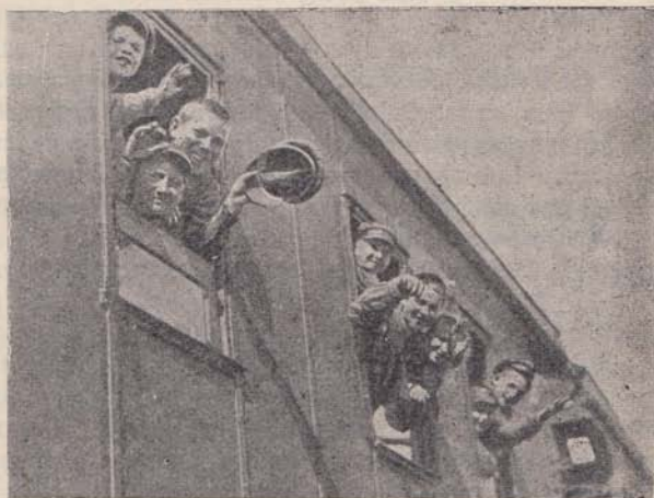
В Москву, на Всесоюзный слет!

На Всесоюзном слете детвора заключила с Наркомземом и птицеводческой кооперацией социалистический договор, по которому дети трудящихся СССР взяли под свое шефство кур, гусей и уток.