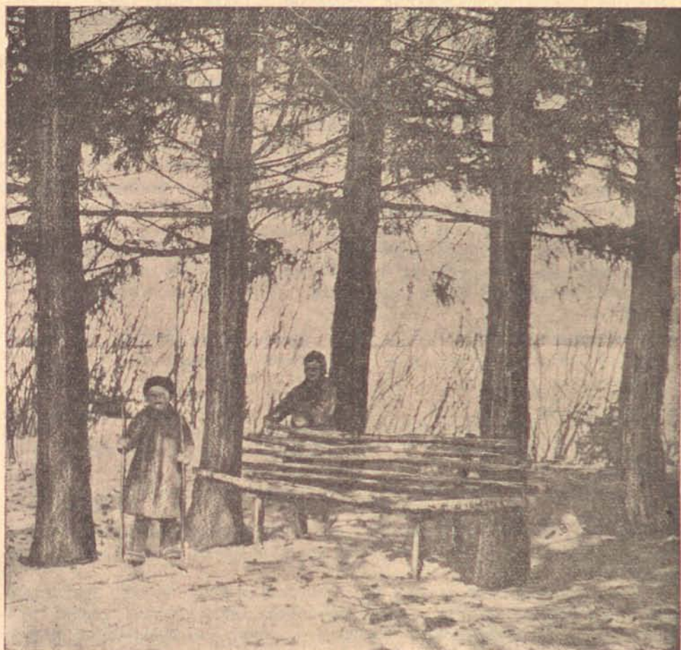
Любимая скамейка Л. Н. Толстого.

Толстого—это хорошо, это лишний раз свидетельствует о том отношении, которое пролетариат проявляет к великим художникам слова.