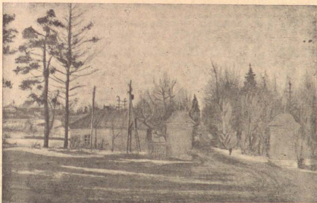
Въезд в Ясную Поляну.

И комнаты, в которых жил и работал Л. Н., и кушетка, на которой он родился, стулья, на которых сидел, бесконечное количество старинных портретов на стенах, подарки, которые посылали ему почитатели—все это, может быть, и интересно для тех, кто хочет знать, как жил не только помещик средней руки, но писатель, «который дал ряд самых замечательных художественных произведений, ставящих его в число великих писателей всего мира», и мыслитель, «который с громадной силой, уверенностью, искренностью поставил целый ряд вопросов, касающихся основных черт современного политического и общественного устройства» *) .