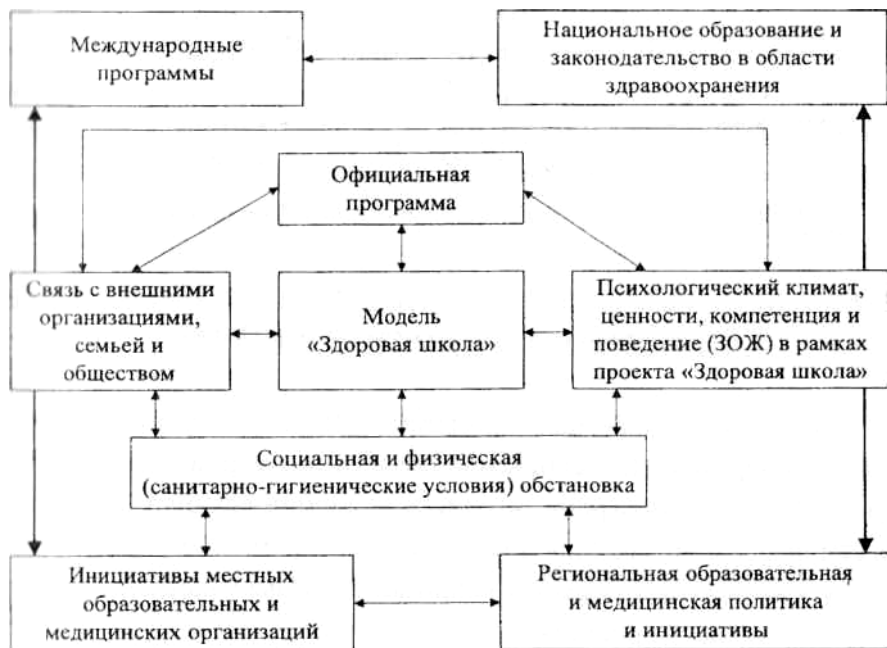
Рис. 1. Модель целостного подхода к концепции здоровых школ

Для школ, занимающихся укреплением здоровья, прослеживается тенденция к предпочтению концепции «компетенции», которая включает навыки, отношения и знания. В последнее время чаще стали указывать на «действие», напоминающее о роли компетенции. Она необходима для того, чтобы люди смогли на самом деле сделать мир другим и повлиять на изменения.