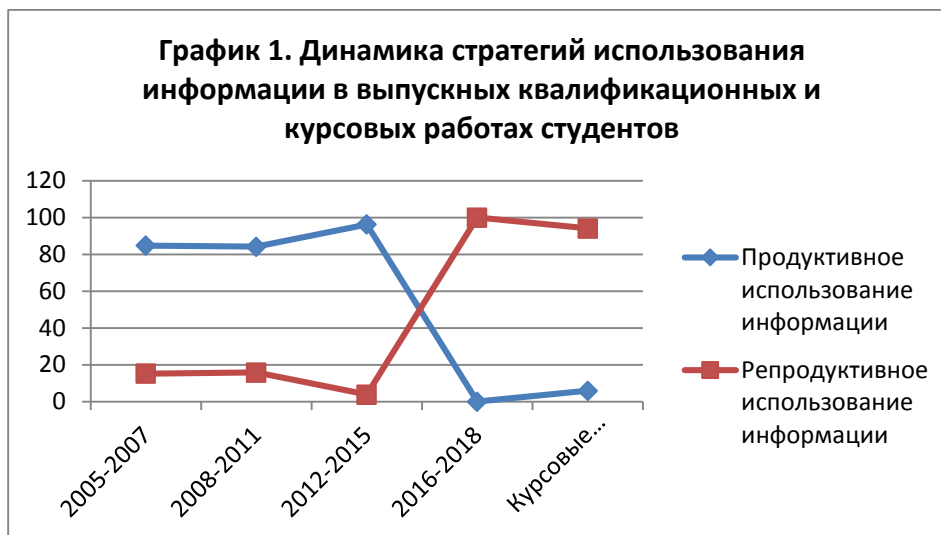
Рис. 1. Динамика стратегий использования информации в выпускных квалификационных и курсовых работах студентов

работах за 2018 год: первый вариант 16 из 17 анализируемых работ представлял собой полное копирование чужих работ или репродуктивное потребление информации (рис. 1).