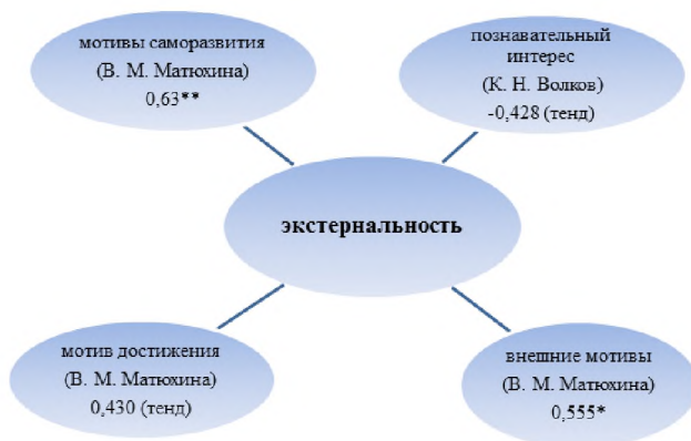
Рис. 2. Корреляционная плеяда экстернальности