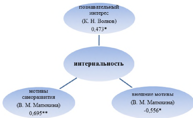
Рис. 3. Корреляционная плеяда интернальности

Обнаруженные взаимосвязи показали, что исследование взаимосвязи локуса контроля имеет большое значение для учебной мотивации подростков.