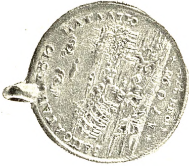
1. Солдатская медаль за Полтавскую баталию, работы Гузн и Хаупт (серебро).