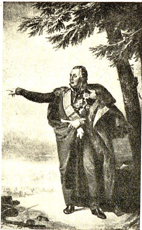
7. Портрет М. И. Кутузова, работы Д. Доу.