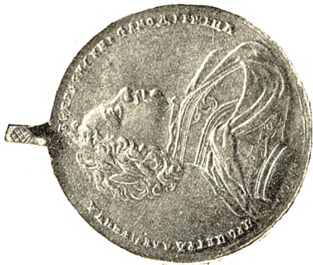
2. Офицерская медаль за Полтавскую баталию, работы Гуэн и Хаупт (серебро).