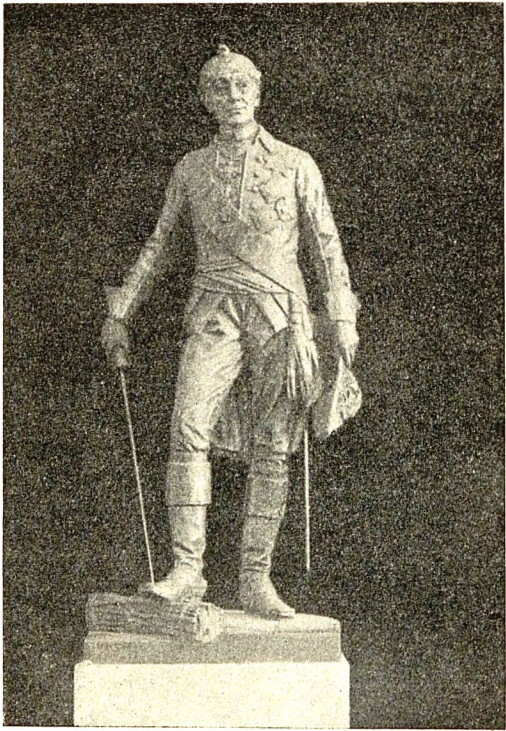
6. Статуя А. В. Суворова, работы И. Шредера.