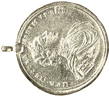
3. Медаль за морское сражение при Гангуте (золото).