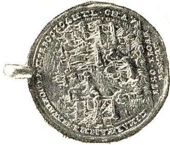
4. Медаль за морское сражение при о. Гренгаме (золото).