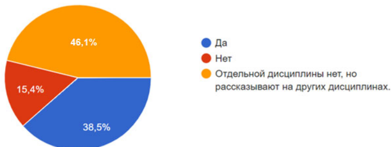
Рис. 1. Процентное соотношение ответов студентов на вопрос: «Есть ли у Вас дисциплина, связанная с изучением специфики инклюзивного образования?»

отдельная дисциплина, посвященная инклюзивному образованию. У 46,1 % опрошенных нет отдельной дисциплины, посвященной изучению инклюзивного образования, однако эту тему затрагивают на других учебных предметах. Для оставшихся 15,4 % студентов тема инклюзивного образования не затрагивается в процессе обучения (рис. 1).